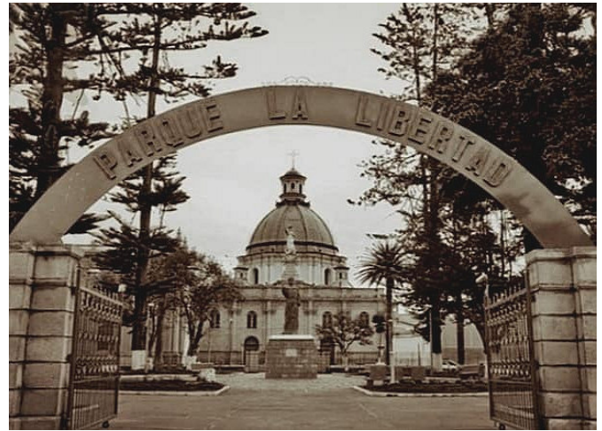
Figura 2. Parque La Libertad en el estado en que fue declarado bien patrimonial (Hernán Mejía Chávez).

El 11 de noviembre de 1920, dentro de los actos del centenario de la emancipación política de Riobamba, se realizó la inauguración del parque con la misma planta que conocíamos hasta este año 2024. En base a este hecho histórico de la emancipación, el 30 de abril de 2021, el Municipio de Riobamba decidió otorgarle el