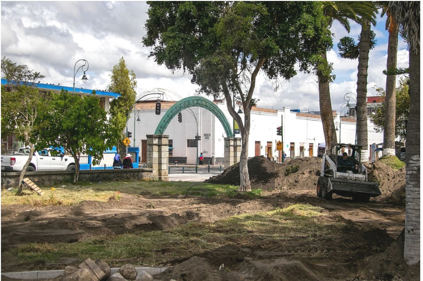
Figura 4. Proceso de destrucción del Parque La Libertad (GAD Municipal de Riobamba).

la composición volumétrica y la estructura portante», algo que no se ha hecho en la intervención realizada sobre el parque. En el caso de que la intervención hubiera sido únicamente de mantenimiento del parque, como bien señala la Carta de Burra en su artículo 1.4 (ICOMOS 1979), solo se permite el «cuidado de protección de la fábrica y el entorno de un sitio y debe distinguirse de reparación», algo que no se ha hecho al observar destrozos en el muro exterior del parque, la estructura y la caminería (figura 4). Asimismo, la solicitud de mantenimiento (reestructuración encubierta) por parte del Municipio de Riobamba, requería de un análisis histórico del sitio y el entorno, algo que, a pesar de contar el municipio con historiadora dentro de su plantilla, no se realizó en ningún momento de la forma adecuada (figura 3).