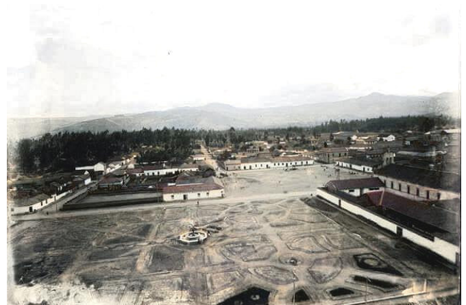
Figura 1. Primera imagen del Parque La Libertad, entonces llamado José Veloz.

ABSTRACT. During the years 2023 and 2024, a series of official correspondence has been maintained between the Municipal Government of Riobamba, Ecuador, and the National Institute of Cultural Heritage (INPC), the regulatory body for heritage in Ecuador. Although powers over heritage have been transferred to the municipalities in the country, the INPC acts as a control body in the event of possible fraudulent interventions. This is the case of the one carried out by the Municipality of Riobamba in the city's La Libertad Park, protected by ministerial agreement