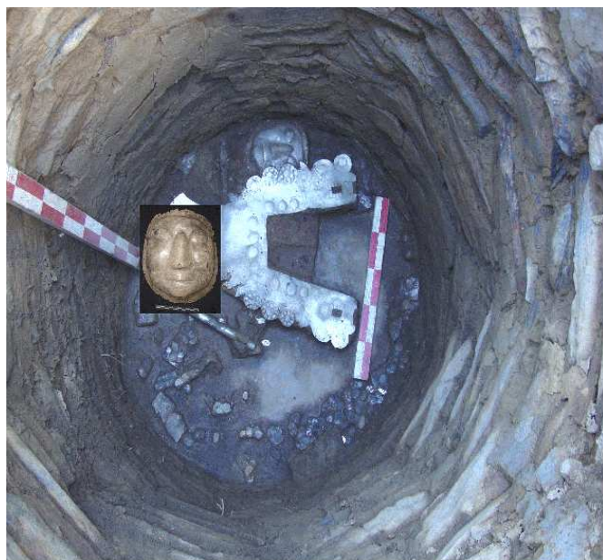
Fig. 4. Aspecto del interior de la tumba.

cia de cinabrio (sulfuro de mercurio) y óxido de hierro, ambos, al parecer, fueron untados en el rostro del personaje. El material cultural recuperado del interior de la estructura de referencia es numeroso y variado. Además de los antes mencionados, la lista incluye una variedad de láminas de plata y cuatro plumas cefálicas, también hechas en plata. En directa asociación con la pechera,