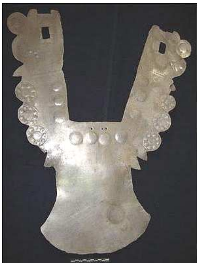
Fig. 5. La pechera de plata del personaje principal.

cia de cinabrio (sulfuro de mercurio) y óxido de hierro, ambos, al parecer, fueron untados en el rostro del personaje. El material cultural recuperado del interior de la estructura de referencia es numeroso y variado. Además de los antes mencionados, la lista incluye una variedad de láminas de plata y cuatro plumas cefálicas, también hechas en plata. En directa asociación con la pechera,