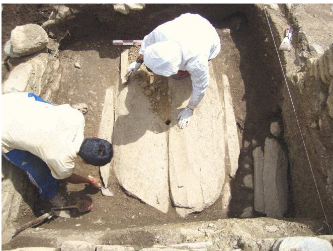
Fig. 2. La tumba principal antes de retirar la cubierta.

Una vez definida la cubierta, se procedió a retirar las lajas, exponiéndose una estructura cilíndrica, ligeramente ovoide (fig. 3), con paredes construidas de piedras unidas con barro (fig. 4) y finalmente enlucidas con una arcilla muy fina de color gris. El diámetro de la estructura es de 1 metro y una profundidad de 1.70 metros. Parte del enlucido había llegado a desprenderse y depositarse en el interior de la estructura. Luego de retirar la acumulación de arcilla fina que se desprendió del enlucido, se expuso un lente de arcilla bastante fina que cubría la parte inferior de la estructura. Retirada dicha cubierta, se llegaron a observar varios objetos depositados como parte del ajuar funerario (fig. 4). Entre estos destacan dos cetros, ambos hechos de madera de chonta (uno de los cuales estaba fragmentado) y forrados con láminas de plata. Además, se expuso la pechera (fig. 5) y una máscara, ambos hechos de plata, pertenecientes al personaje allí depositado. La máscara mantenía una orientación hacia el noreste y posiblemente cubría el rostro del personaje. Al mismo tiempo, se halló un total de 687 cuentas de turquesa, calcita, malaquita, serpentina, todas descubiertas en la parte inferior de la máscara. Del mismo modo, en el interior de la máscara se constató la presen-