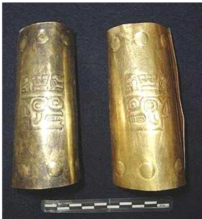
Fig. 6. Brazaletes de oro con representaciones antropomorfas y zoomorfas típicos de la cultura Wari.

también se hallaron dos brazaletes de oro (fig. 6), ambos con representaciones antropomorfas y zoomorfas, estilísticamente típicas de la cultura Wari. Al mismo tiempo, se recuperó un total de 230 pequeñas láminas de plata, de forma ovoide, cada una con dos orificios en uno de sus extremos. Las láminas debieron ser parte de la ornamentación del vestido del personaje allí depositado.