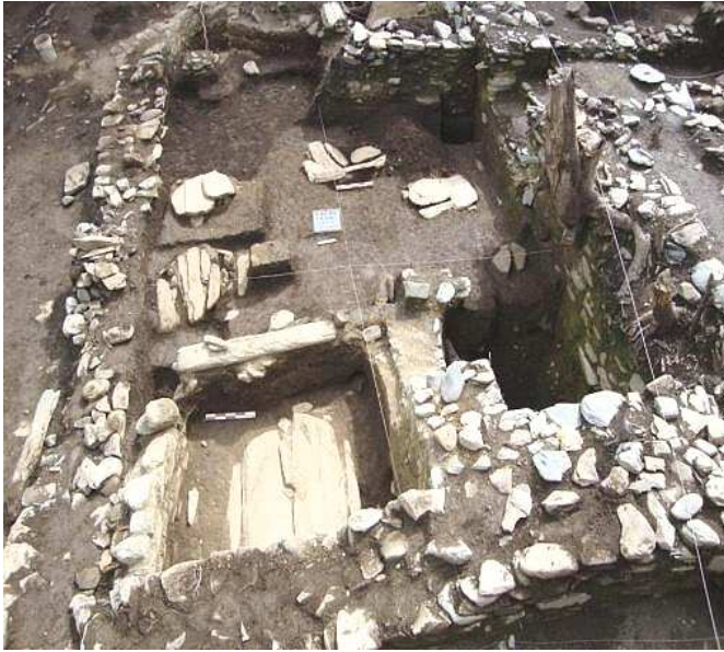
Fig. 1. Unidad arquitectónica n.º 6. La tumba principal se encuentra en la esquina inferior izquierda.

merosas estructuras de diferentes tamaños y formas, además de estructuras mortuorias. Entre estas destaca una tumba hallada en su contexto original y como tal tiene mucho significado. Este reporte tiene el propósito de describir el referido hallazgo.