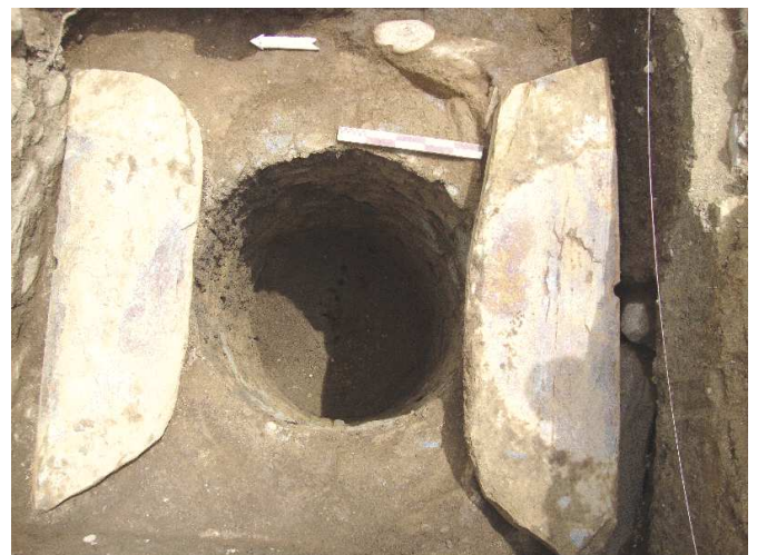
Fig. 3. La tumba principal una vez retirada la cubierta.