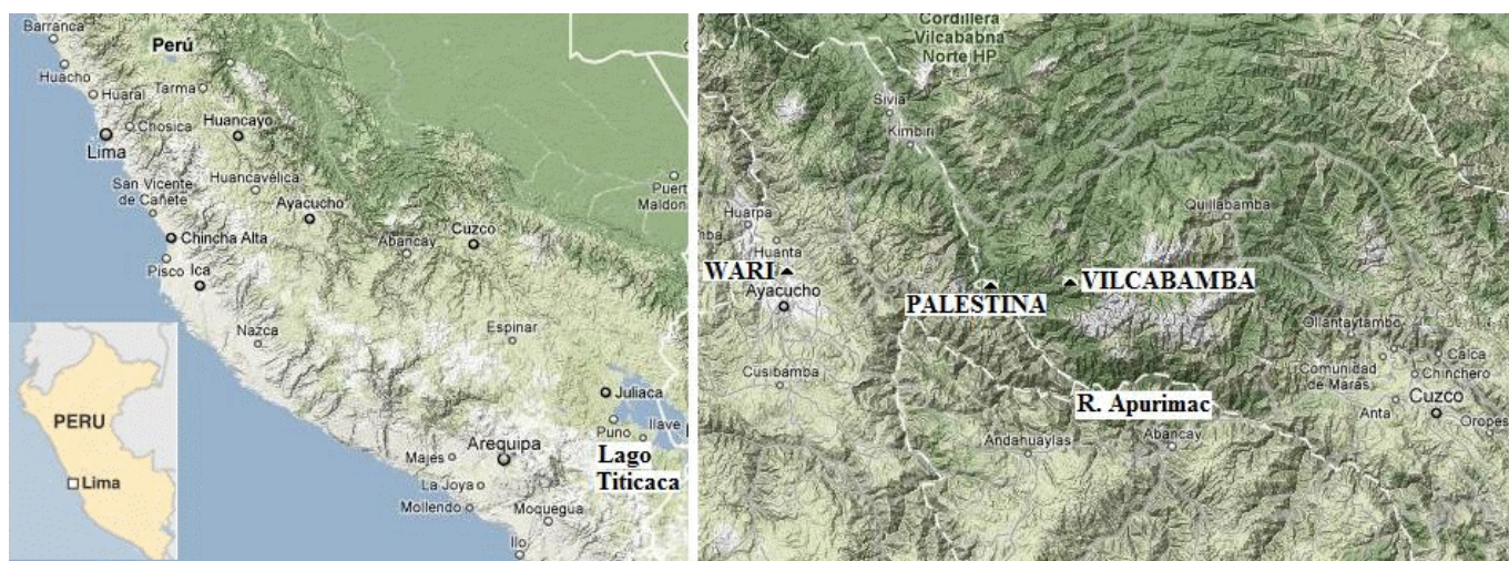
Fig. 1. Ubicación de Vilcabamba.

ABSTRACT. Following the unprecedented discovery of an elite Wari burial (circa AD 550-1000) in the tropical region (Vilcabamba) northwest of Cuzco (Peru), this past March the Peruvian Ministry of Culture-Cuzco organized the First Colloquium named Tras las Huellas de los Wari. The colloquium was aimed at discussing the archaeological implications of the new findings from Vilcabamba.