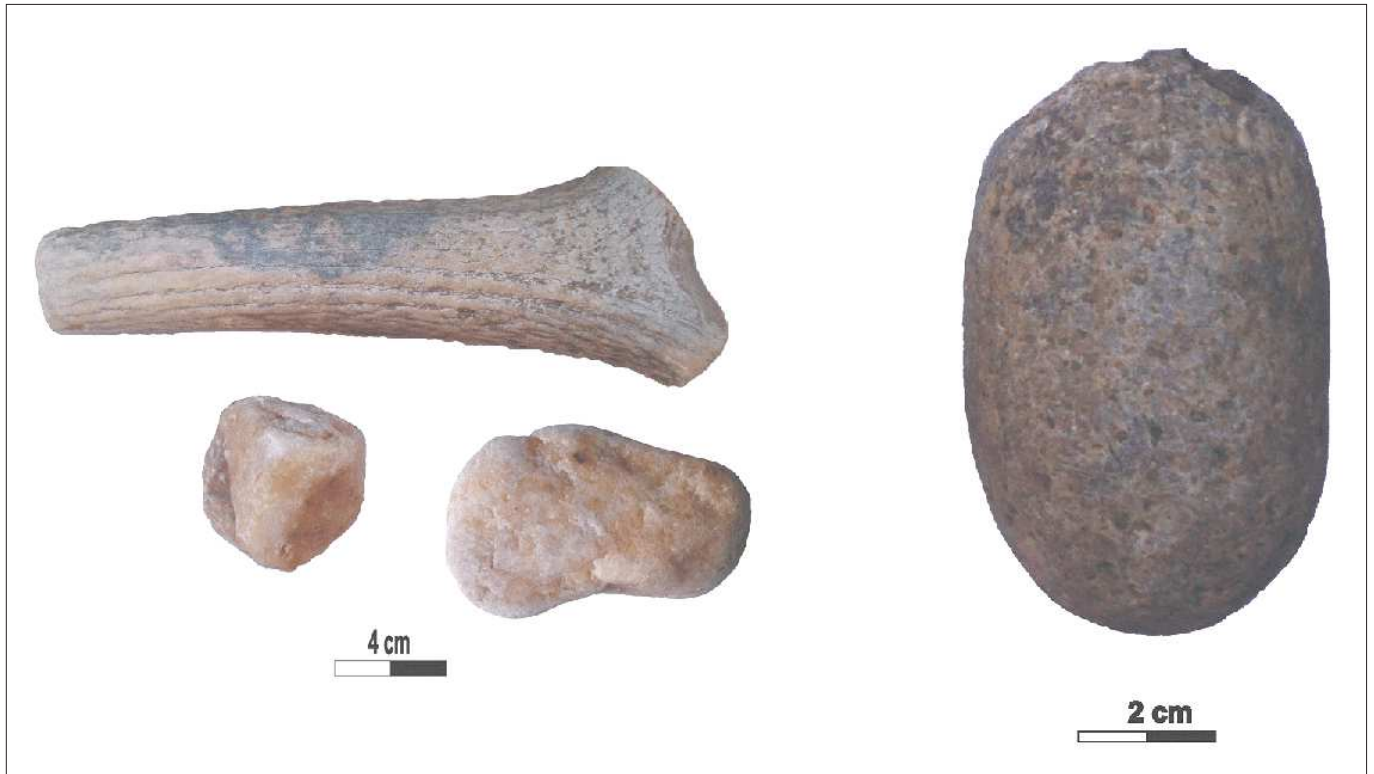
Figura 1. Percutores utilizados en las experiencias. Un percutor de asta de ciervo, dos de cuarzo y uno de granito.

técnicos, la presencia de golpes fallidos, los cambios en las características de la roca en cuanto a su calidad y, sobre todo, se tuvieron en cuenta los cambios en las técnicas del tallador.