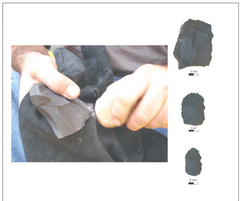
Figura 2. Secuencia de manufactura de bifacez.

Con respecto al tamaño de los desechos, utilizamos el módulo formulado por Bagolini como lo propone Aschero (1975). Del total de desechos enteros generados en los