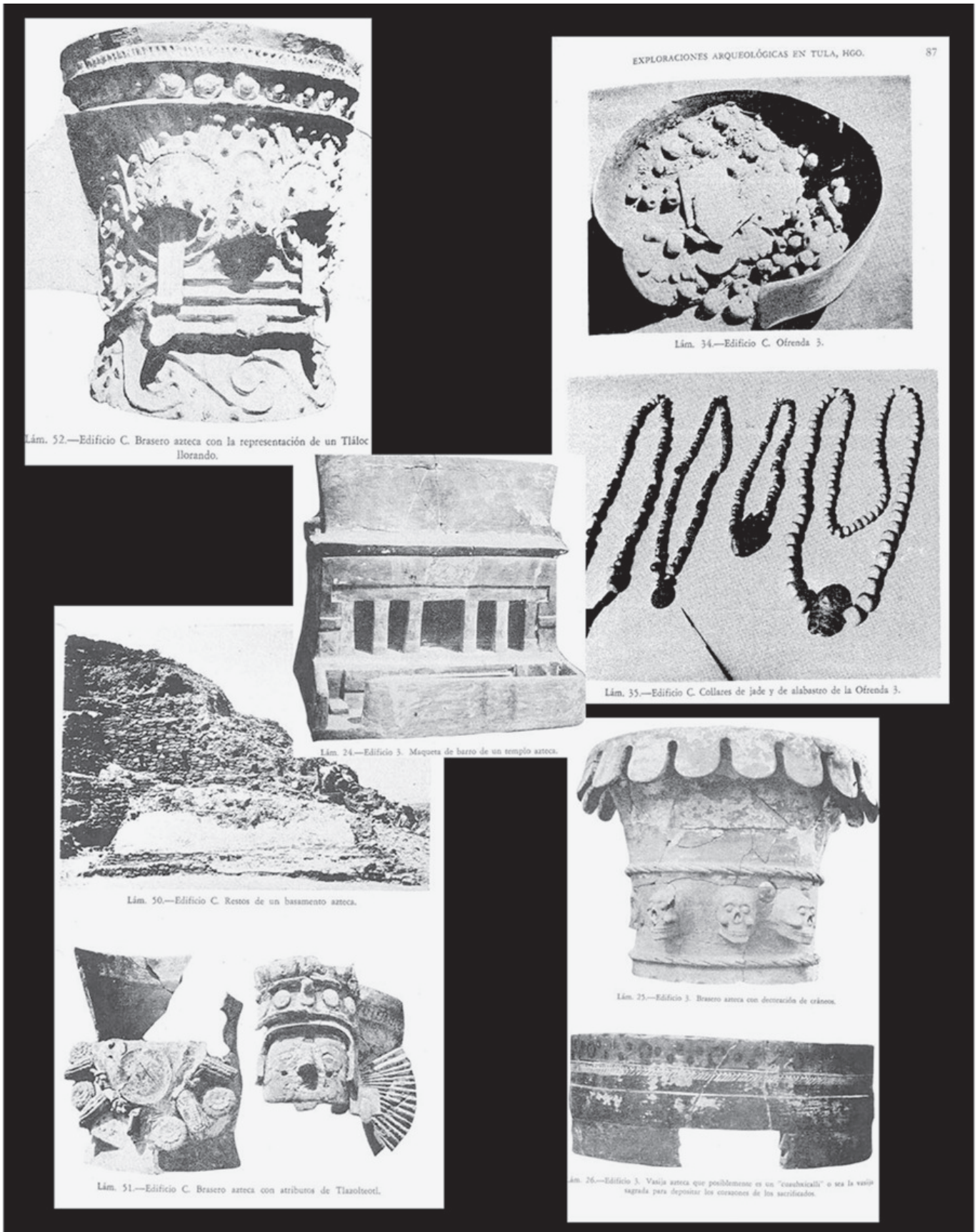
Figura 5. Selecciones de artefactos aztecas de las excavaciones de Acosta. Arriba a la izquierda : brasero azteca con un motivo de «Tlaloc llorando» de la Pirámide C (Acosta 1956b: 110, lám. 52). Arriba a la derecha : cerámica y collares de jade y alabastro de la Pirámide C (Acosta 1956b: 87, láms. 34 y 35). Abajo a la derecha : brasero y cuauhxicalli (receptáculo para los corazones humanos sacrificados) del Palacio Quemado (Acosta 1956b: 76, láms. 25 y 26). Abajo a la izquierda : altar y brasero azteca de la Pirámide C (Acosta 1956b: 109, láms. 50 y 51). Centro : maqueta del Palacio Quemado (Acosta 1956b: 73, lám. 24).