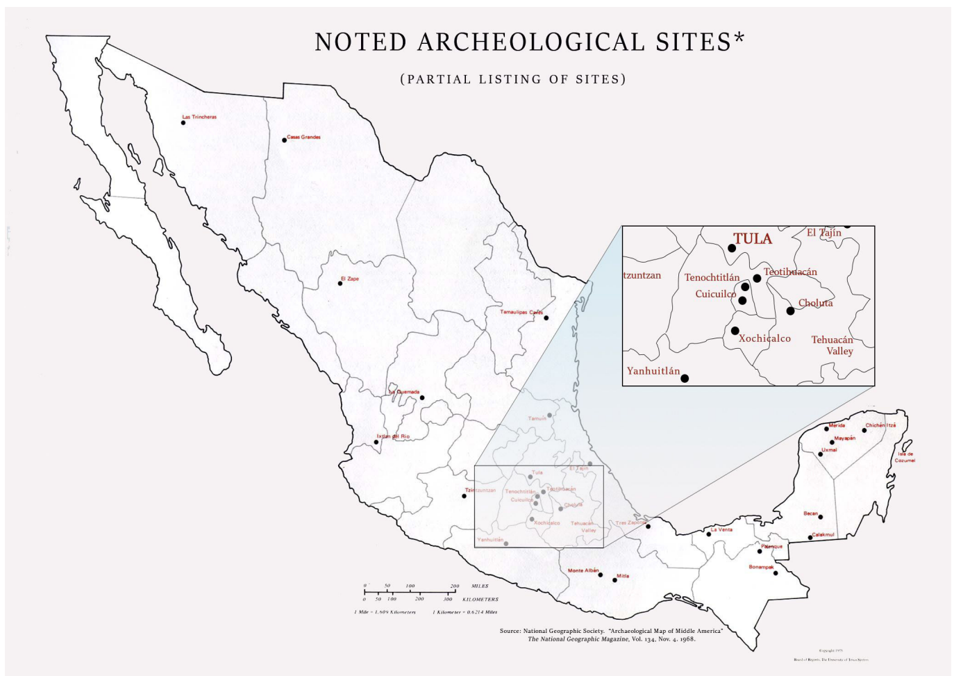
Figura 1. Sitios arqueológicos mencionados en el texto y una inserción que muestra la ubicación de Tula (Junta de Regentes de la Universidad de Texas, 1975, adaptada por la autora. Imagen cortesía de las Bibliotecas de la Universidad de Texas, Universidad de Texas en Austin).

Rice University, Houston, Texas, USA ( s.dugan.iverson@gmail.com )