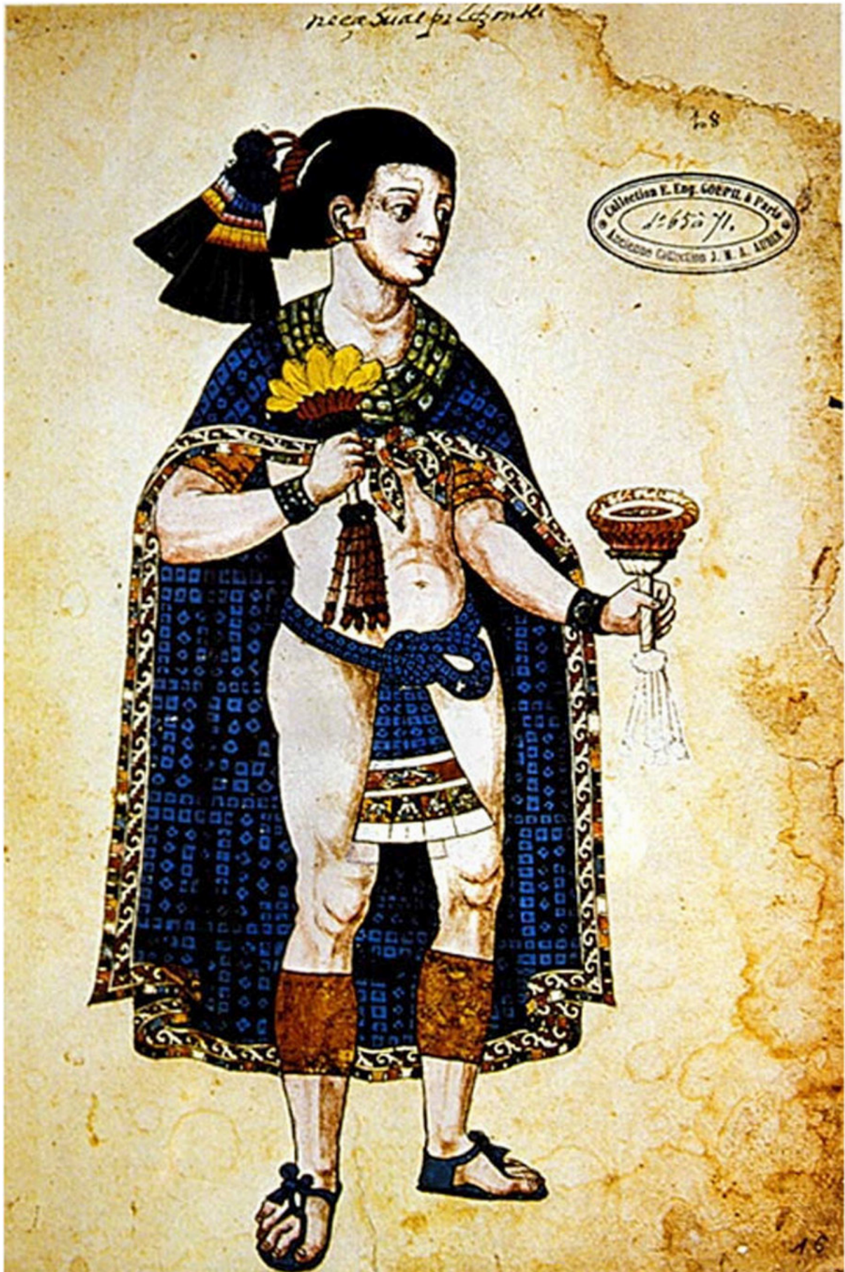
Figura 4. Nezahualpilli , gobernante de Texcoco, con la capa azul real. Reproducción cortesía de Wikimedia Commons: http://es.wikipedia.org/wiki/Nezahualpilli#mediaviewer/File:Nezahualpiltzintli.jpg .