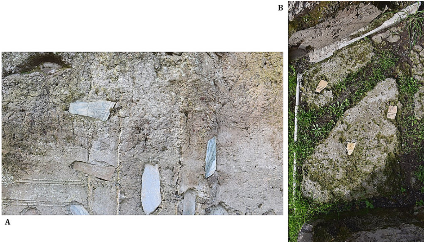
Figura 8. Capas de preparación de revestimiento marmóreo: parietal (A) y de pavimento (B). Impronta de un opus sectile parietal (A).

cia cómo en los mismos ejemplares aparecen distintos fragmentos que originalmente formaron parte de la misma pieza.