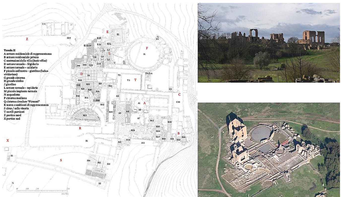
Figura 1. Planta (Paris et al. 2019) y vista general de la «Villa dei Quintili».

Departamento de Ciencias Históricas, Universidad de Málaga, España (✉ dbecerra@uma.es )