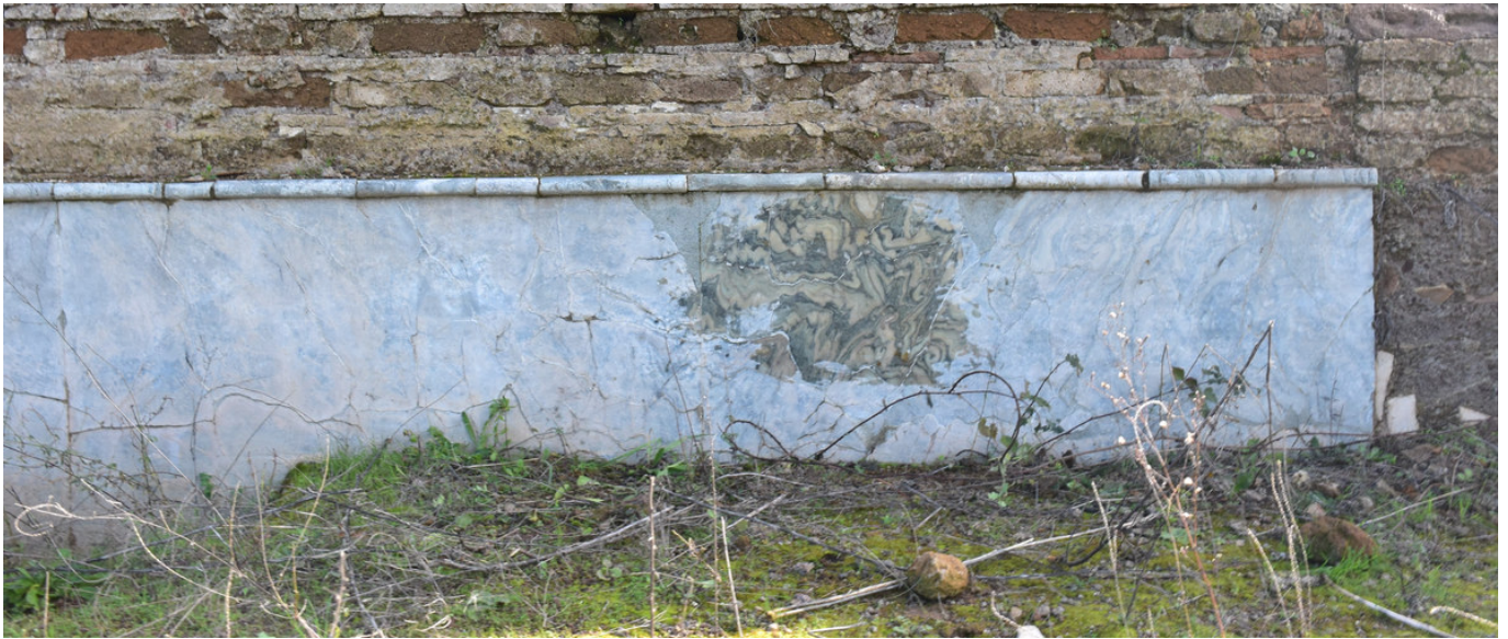
Figura 4. Revestimiento marmóreo parietal en «cipollino» con losas confrontadas y decoración simétrica.