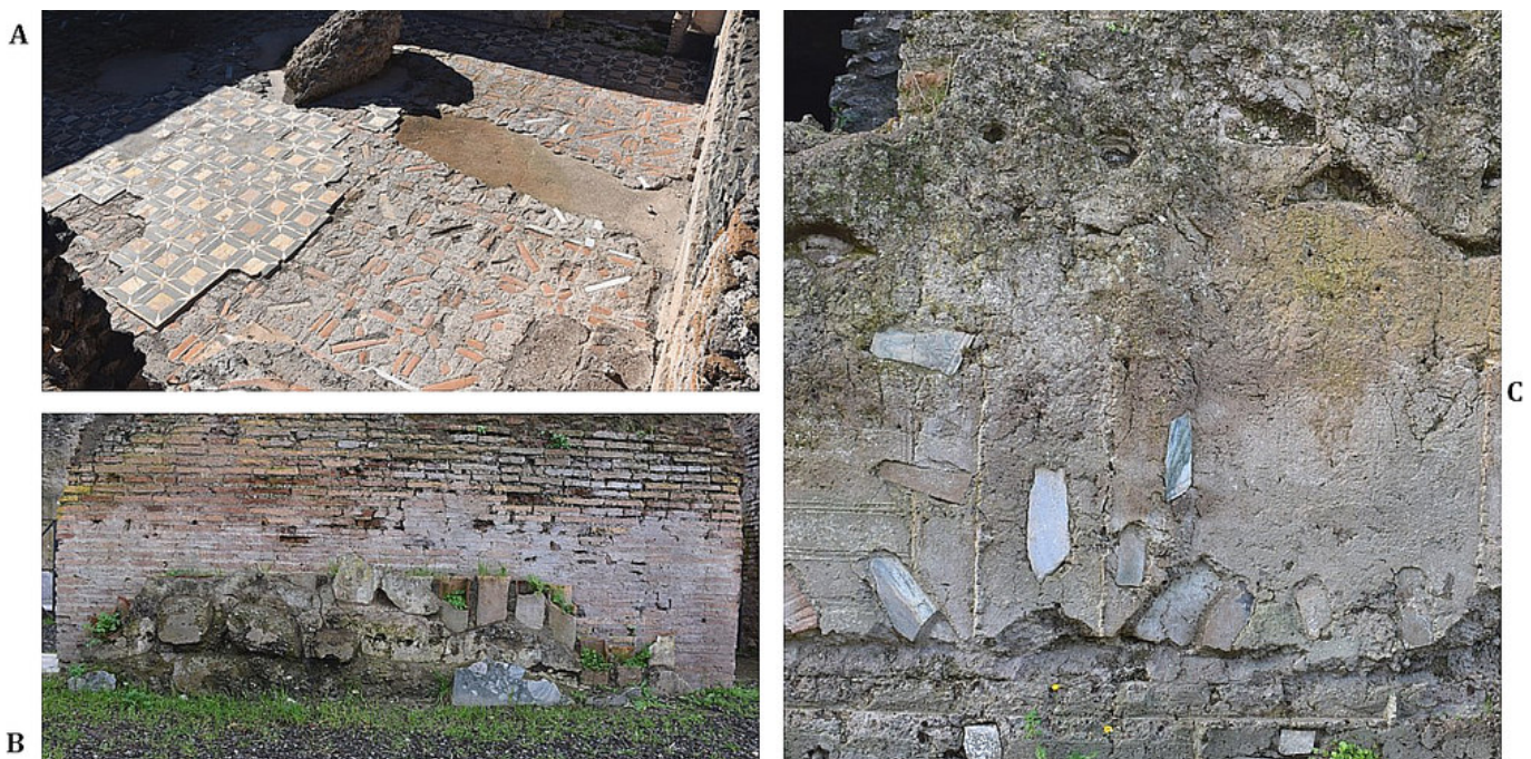
Figura 7. Capa de preparación de los revestimientos parietales.

pollino», Luni, «africano», «fior di pesco», «rosso antico», «portasanta», «greco scritto», «verde antico», etc. Muchos de ellos presentan partes molduradas de un uso precedente, sobre todo, el «cipollino» (figura 8-A) y el «giallo antico» (figura 8-B). En diversos casos se apre-