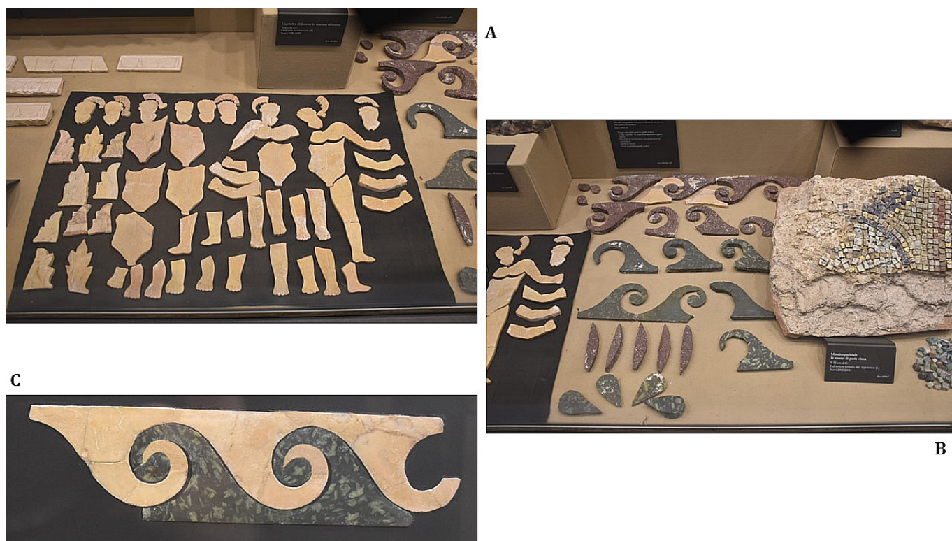
Figura 2. Placas de revestimiento en opus sectile parietal con motivos figurados y geométrico-figurados.

elementos arquitectónicos. También constatamos un uso importante del motivo decorativo de ondas vitruvianas , elaborado gracias a placas en «giallo antico», «porfido rosso» y «serpentino» (figuras 2-B y 2-C). Los restos de revestimientos parietales mencionados fueron hallados en el sector de representación (A), en el edificio octogonal.