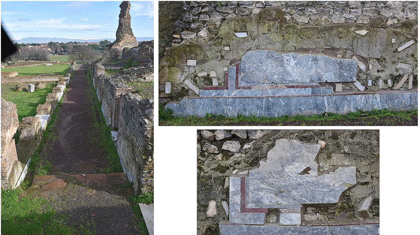
Figura 3. Opus sectile de los pórticos de los patios.

connesio» son las variedades lapídeas que revisten las paredes del frigidarium , a pesar de desconocer el desarrollo del diseño del sectile .