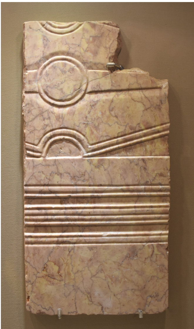
Figura 5. Placa parietal en Buixcarró con decoración en relieve.

antico», «rosso antico» (figura 6-B) y en mármol blanco. En los accesos de los espacios vinculados al caldarium se conservan in situ , justo delante del sistema de calentamiento de la estancia (figura 6-A), restos de estos fustes de pilastras, en esta ocasión en mármol blanco, posiblemente de Luni-Carrara.