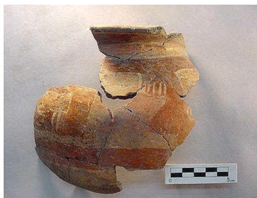
e) Tipo Memo, Bolaños