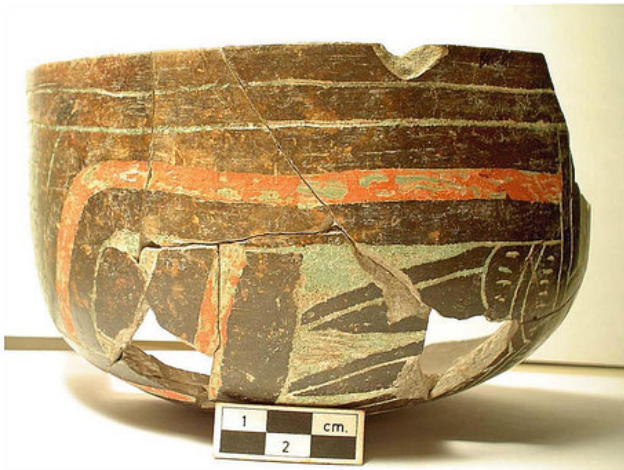
c) Champlevé, Tizapán El Alto, Michoacán