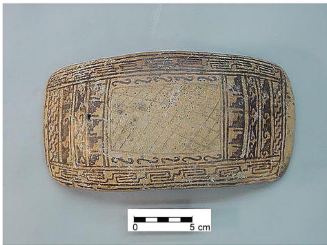
a) El Piñón, Bolaños