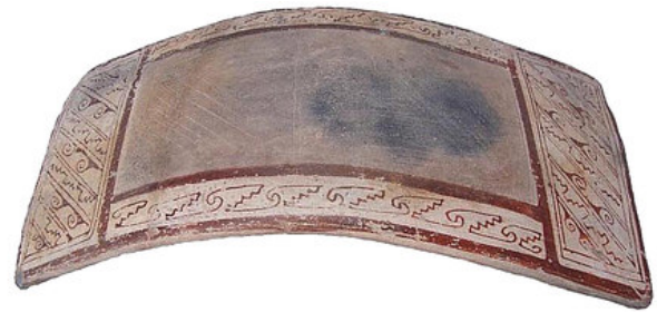
b) El Teúl, Zacatecas