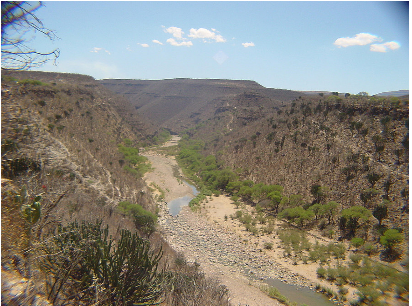
Figura 3. Vista del río y vegetación del cañón.

específicamente con la cuenca de Sayula (Valdez et al. 2005) y el sitio de Atizapán el Alto (Meighan y Foote 1968), y hacia el este en la zona de Tlaltenango (El Teul y Las Ventanas) (Darling y Jiménez 2000); todo ello reflejado en la cerámica tipo Memo (Cabreró y López 2002), las figurillas tipo Cerro García (Valdez et al. 2005) y las tablillas en El Teul (Darling y Jiménez 2000); y al oeste con Amapa en Nayarit (Meighan 1976) (figura 4).