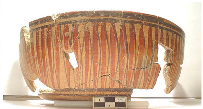
d) Tipo Gavilan, Amapa, Nayarit