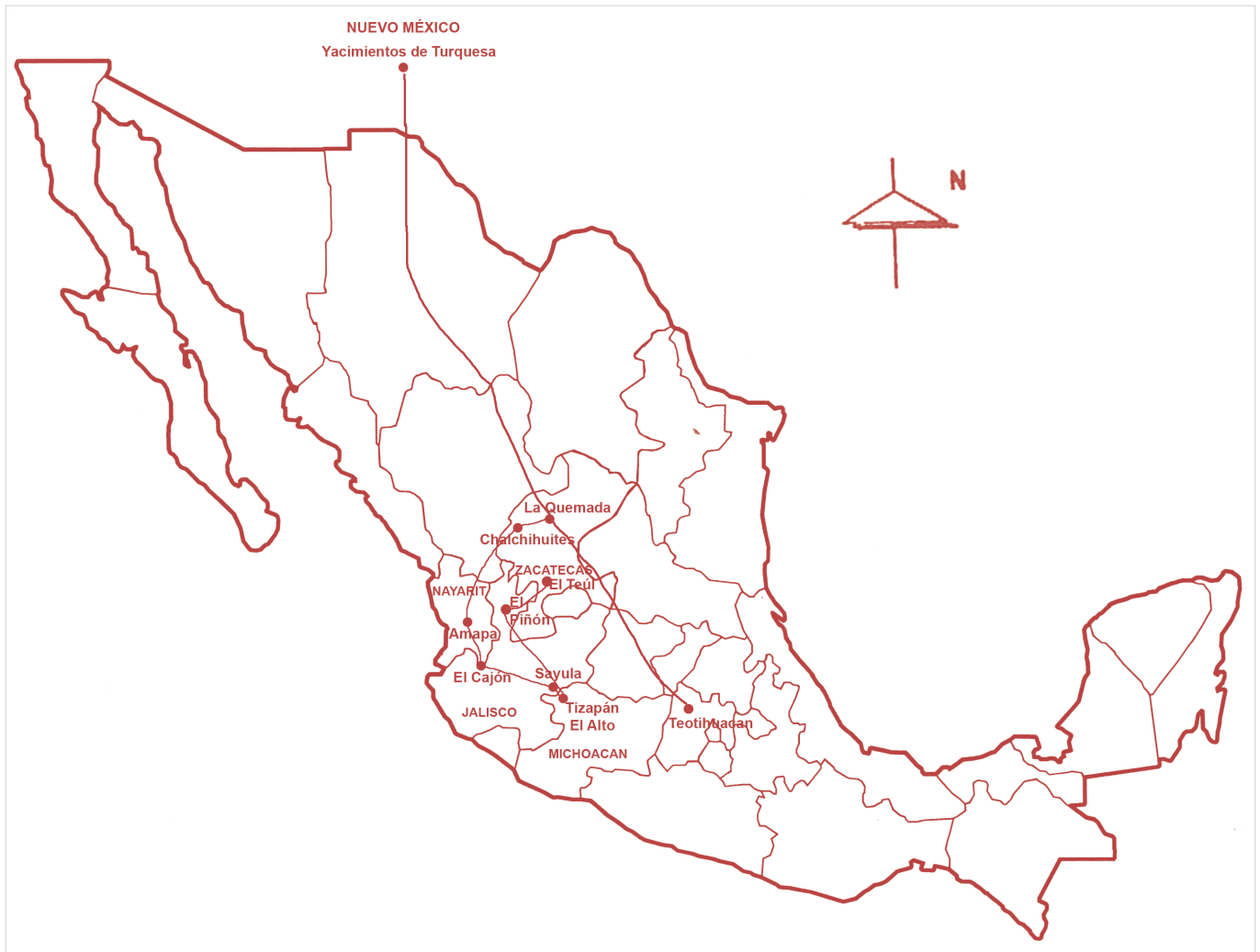
Figura 6. Dinámica de la ruta comercial de Bolaños y ruta para la obtención de turquesa propuesta por Kelley (1976, 1980).

rior propuesta por Kelley (1976, 1980) (Cabrero y López 2002; Cabrero 2018).