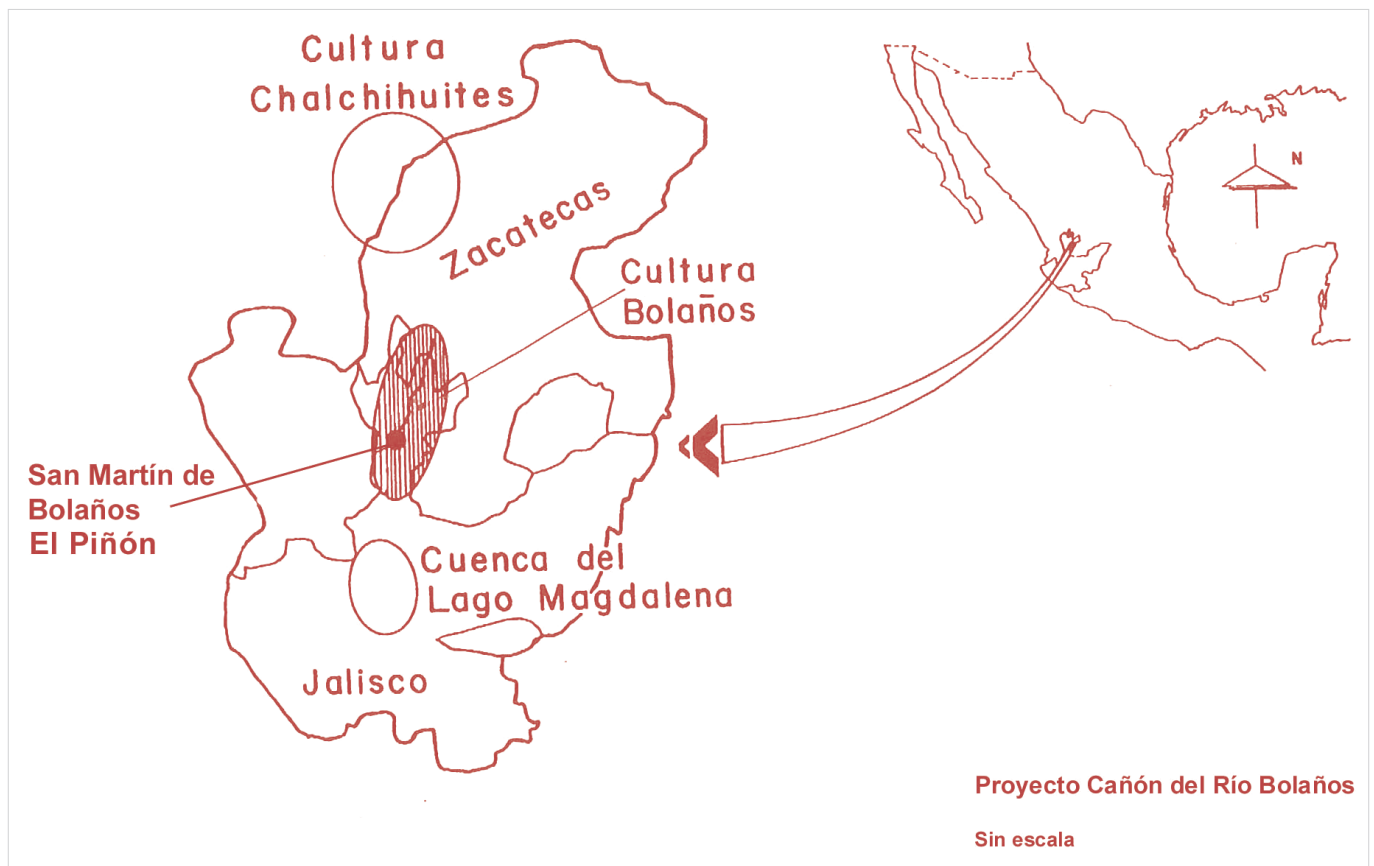
Figura 1. Localización del cañón de Bolaños en México.

Instituto de Investigaciones Antropológicas, UNAM, México (✉ cabrerot@unam.mx )