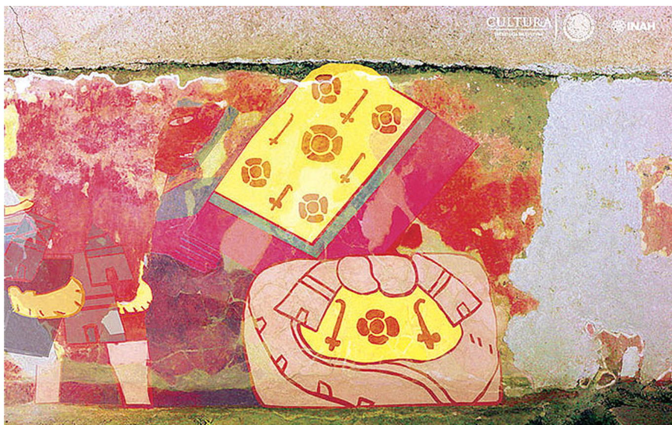
Figura 6. Trabajo digital basado en los diseños del mural. Se resaltan los elementos de la composición pictórica (Jorge N. Archer).