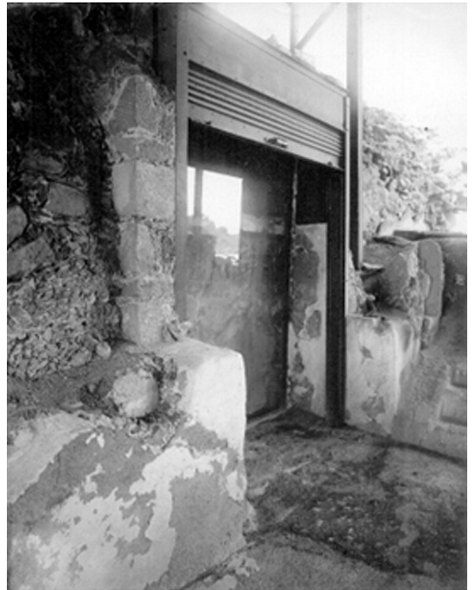
Figura 1. Mural del Templo de la Agricultura protegido con vidrio (c. 1919). Fototeca Nacional del INAH, México.

Entre los años cuarenta y sesenta del siglo XX continuaron las exploraciones dentro de una visión científica que la arqueología fue perfeccionando, pero los grandes saqueos de pintura mural en las inmediaciones de las pirámides del Sol y la Luna propiciaron trabajos de investigación en conjuntos como Tepantitla, Atetelco y Tetitla. En 1942, el artista, pintor y dibujante Agustín Villagra Caletí realizó los calcos de los murales recientemente descubiertos en Tepantitla, después de lidiar con la capa de cal que se había aplicado a las pinturas para su protección. Villagra presentó un breve resumen sobre las técnicas que en ese entonces se empleaban para la conservación de estos materiales, las mismas que incluían el uso de lechadas de cal y lacas —se menciona la de la marca «Dulux»— (Villagra 1952).