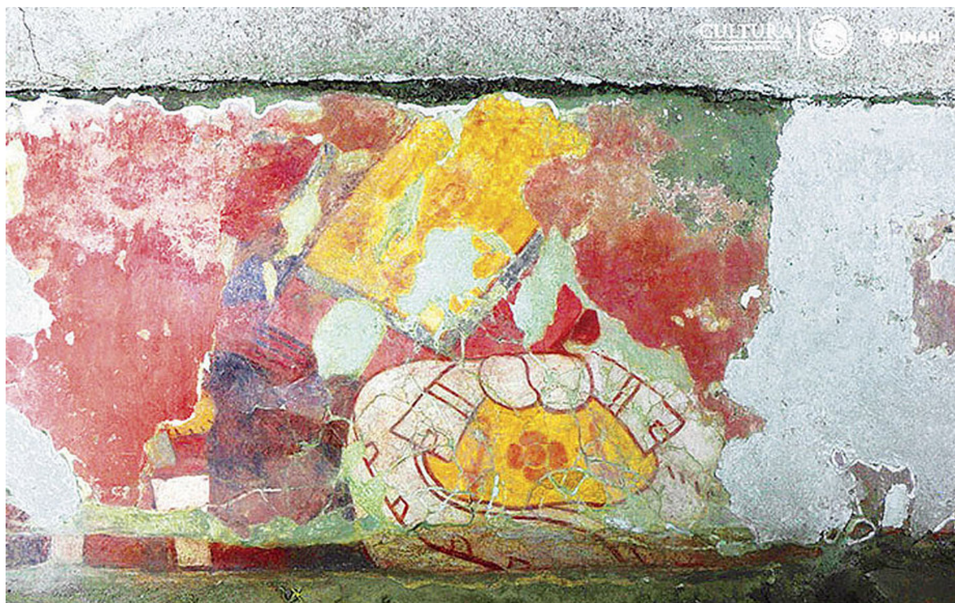
Figura 5. Detalle del mural descubierto recientemente.