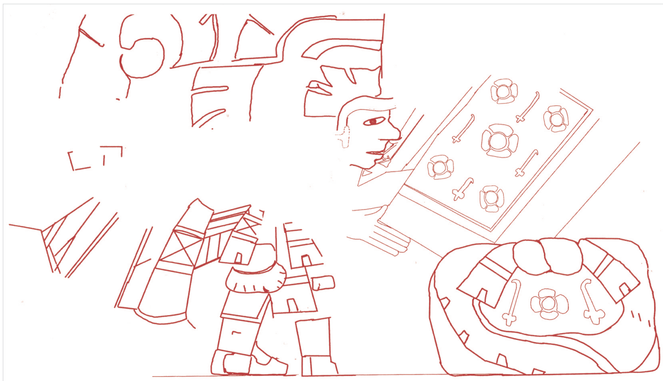
Figura 4. Diseños del mural de personajes en procesión con bultos. Vectorización de Jorge N. Archer.

Además, se observan restos de los pies de otro personaje y, frente a él, una figura blanca, ovalada, delineada en rojo, que semeja un bulto anudado en su parte superior, de donde cuelgan los extremos de la tela o piel, ya que en el borde derecho presenta una hilera en diagonal de pequeñas líneas paralelas (Von Winning, op. cit. ) formando franjas y pequeños cuadretes sobre el fondo blanco del bulto. A su vez, este encierra, en un fondo amarillo, la representación de una flor roja de cuatro pétalos con un lanzadardos ( átlatl ) a cada lado. Sobre el bulto se observa una figura romboidal (posiblemente un lienzo de tela o papel) conformada por una amplia franja roja, seguida de una franja azul más delgada que encierra un rectángulo amarillo con los restos de cuatro lanzadardos ( átlatls ) colocados en forma de cruz, alternados con flores de cuatro pétalos, una de ellas en el centro de la composición. A la altura de este diseño, del lado izquierdo y apenas perceptible, se distingue un perfil humano con ojo, nariz y boca finamente delineados (figuras 5 y 6).