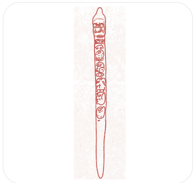
Figura 1. Posible herramienta prehispánica para tejido proveniente de la tumba 2, edificio 23, Yaxchilán, Chiapas, México (adaptado de Stuart 2013).

Como parte de la ofrenda de la tumba 2 del edificio 23 de Yaxchilán, donde, según los especialistas, posiblemente fue enterrada la señora Ix K'abal Xook, esposa del gobernante Itzamnaaj B'alam III, se encontraron nueve huesos incisos considerados como perforadores; seis de estos portan el nombre jeroglífico de Ix K'abal Xook (Mathews 1997: 276; McAnany y Plank 2001: 115). Sin embargo, al estudiar dos de los artefactos con el nombre de la referida mujer, David Stuart (2013) se mostró escéptico sobre su uso como sangradores debido a la apariencia obtusa de su punta, con lo cual coincido. Hasta la fecha no se cuenta con ninguna interpretación viable sobre la función de estos artefactos. En la presente nota argumento, a partir de similitudes etnográficas y el contexto arqueológico de la ofrenda, que uno de los huesos tallados referidos por Stuart era en realidad una herramienta para tejer, en particular un separador de hilos (figura 1).