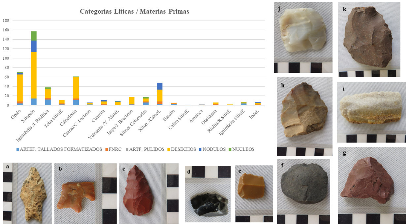
Figura 3. Gráfico de categorías líticas/materias primas. Además, se presentan algunos materiales arqueológicos de EC: a) punta de proyectil de materia prima indeterminada; b) punta de proyectil pedunculada, fracturada, de sílice coloreado; c) punta unifacial apedunculada o preforma de jaspe; d) filo natural de obsidiana; e) raspador con filo frontal corto + raedera de sílice coloreado; f) cuchillo con filo natural de basalto; g) cuchillo con filo natural (bifaz de ignimbrita silicificada); h) muesca de xilópalo; i) filo natural de cuarzita; j) cuchillo con filo natural de calcedonia; k) cuchillo bifacial de ignimbrita riolítica.