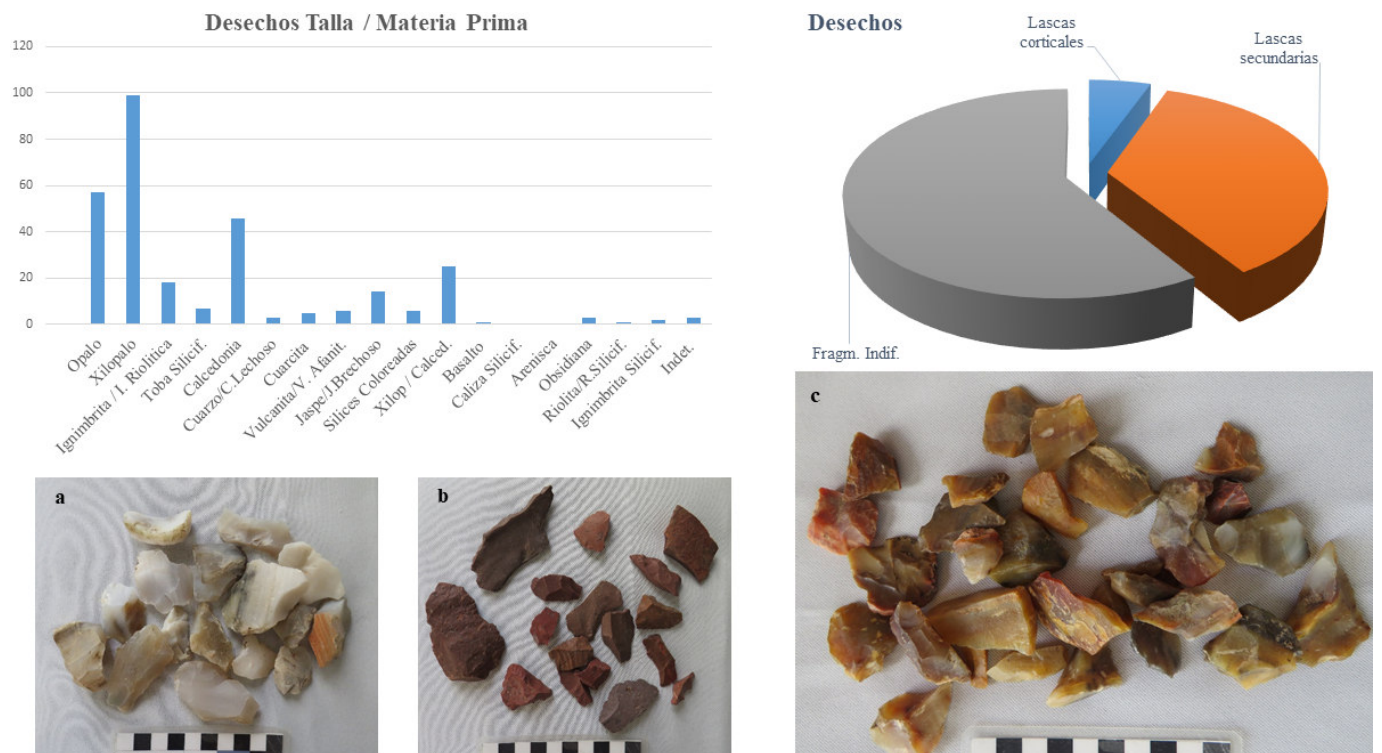
Figura 4. Gráficos de desechos de talla/materia prima y tipos de desechos del sitio EC. Fotografías de lascas nucleiformes y desechos de calcedonia (a), desechos de ignimbrita (b) y desechos de xilópalo (c).